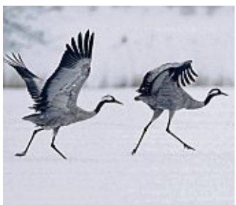
Startklar: zwei Kraniche auf dem Weg in den Süden

Hin und her: Beim Flug der Kraniche über Hessen beobachtet der Naturschutz Nabu in diesem Jahr eine ungewöhnliche Situation. Grund ist eine Watterscheide mit niedrigen Temperaturen im Nordosten und höheren im Süden. Wenn es im Norden zu kalt ist, fliegen die Tiere wieder zurück Richtung Süden. In Hessen erlebt man deshalb derzeit einen „Zugstau“. Man muss sich aber keine Sorgen um die Kraniche machen. Sie frieren nicht. In den Zugformationen sind immer erfahrene Tiere dabei, die geeignete Rastgebiete finden. (epd)