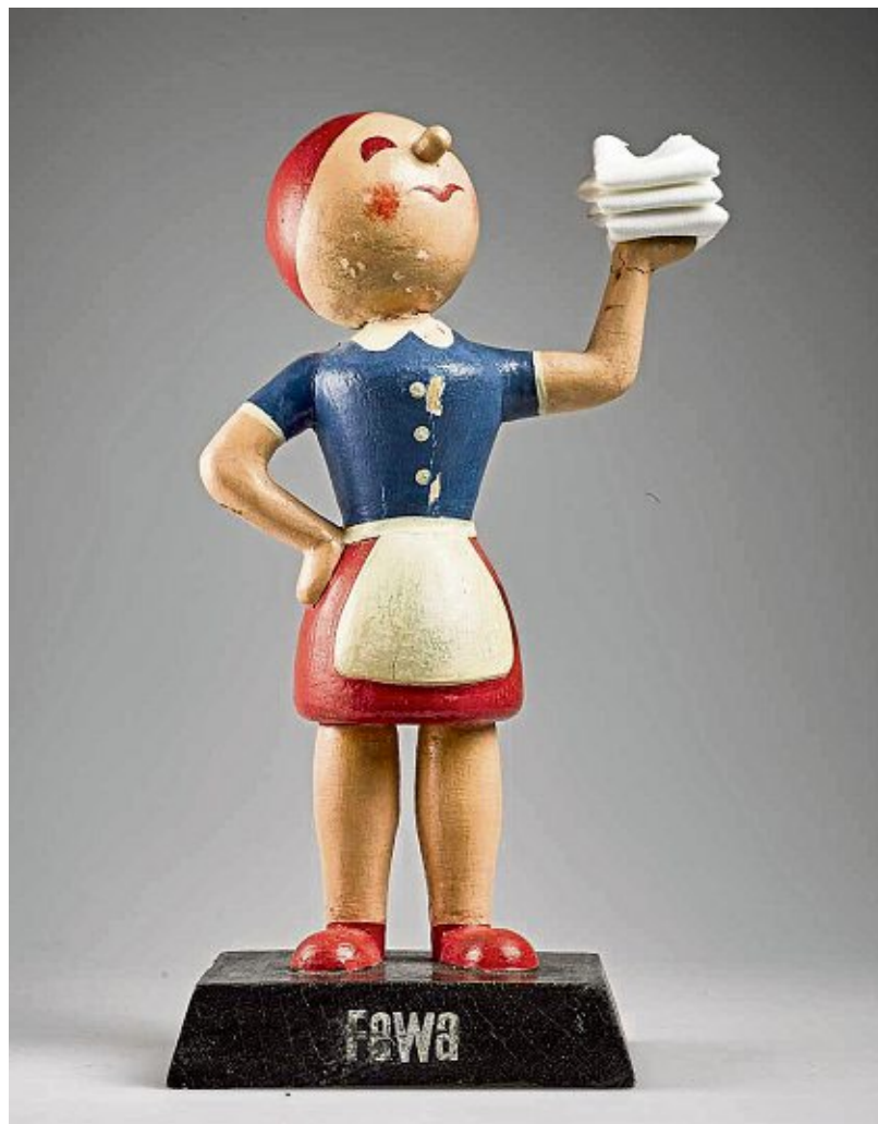
Die Fewa-Johanna warb für ein Produkt des VEB Fettchemie Karl-Marx-Stadt.

Hin und her: Beim Flug der Kraniche über Hessen beobachtet der Naturschutz Nabu in diesem Jahr eine ungewöhnliche Situation. Grund ist eine Watterscheide mit niedrigen Temperaturen im Nordosten und höheren im Süden. Wenn es im Norden zu kalt ist, fliegen die Tiere wieder zurück Richtung Süden. In Hessen erlebt man deshalb derzeit einen „Zugstau“. Man muss sich aber keine Sorgen um die Kraniche machen. Sie frieren nicht. In den Zugformationen sind immer erfahrene Tiere dabei, die geeignete Rastgebiete finden. (epd)