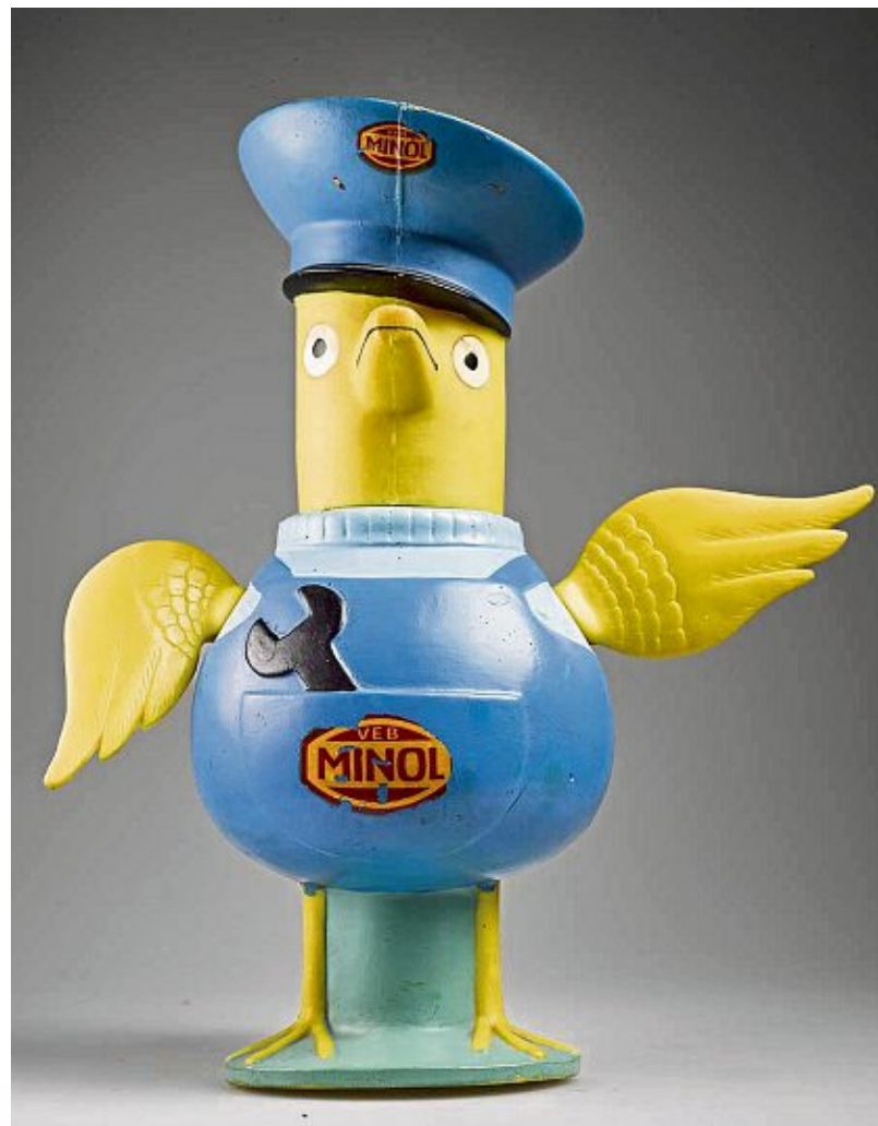
Der Minol-Pirol, Maskottchen des VEB Kombinats Minol